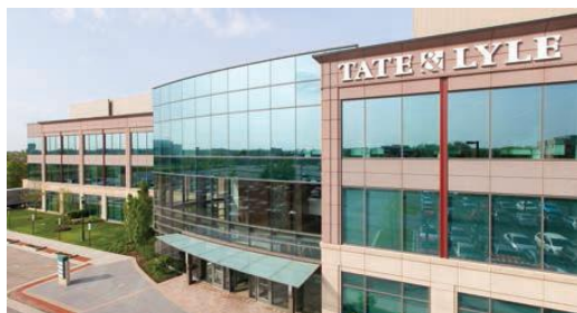
TATE&LYLE 社のコマーシャル&フード・イノベーション・センター (米国イリノイ州 Hoffman Estates)